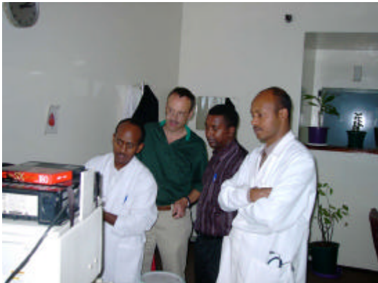
Praktische Übungen nachmittags