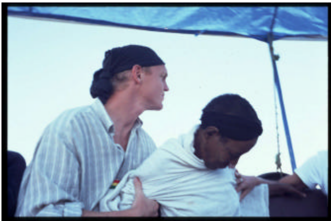
Erste Hilfe auf dem Tanasee (Seekrankheit)