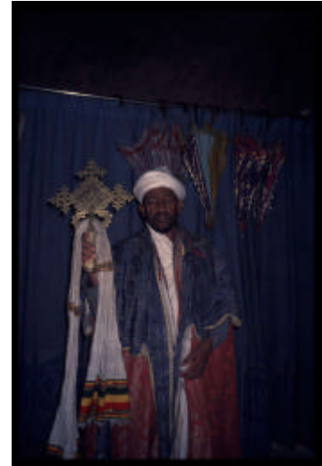
In den Fels gehauene Kirchen in Lalibela