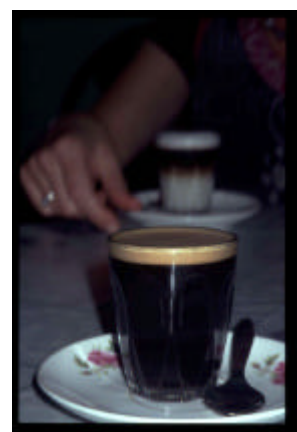
Das Essen schmeckt nicht jeder, es gibt aber auch Makkaronie, und der Kaffee ist vorzüglich (früher italienische Kolonie)