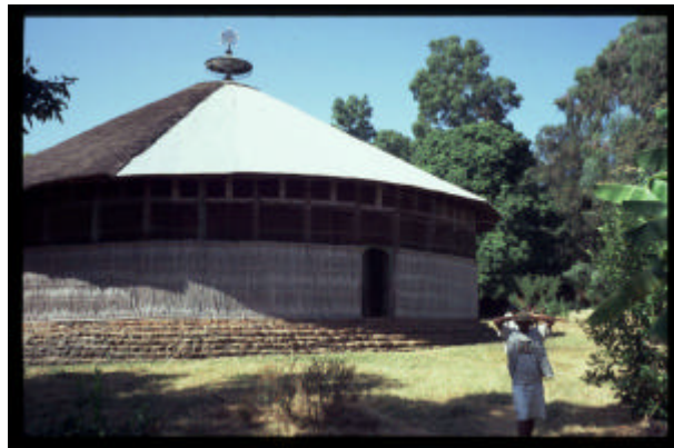
Alte christliche Klöster