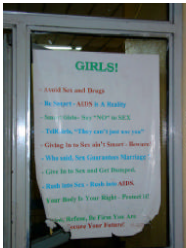
HIV nimmt auch in Äthiopien zu