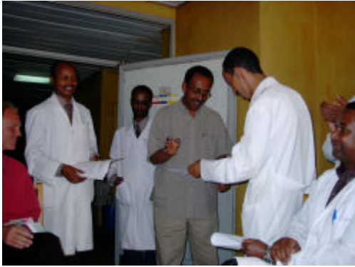
Verteilung der Kursbescheinigungen