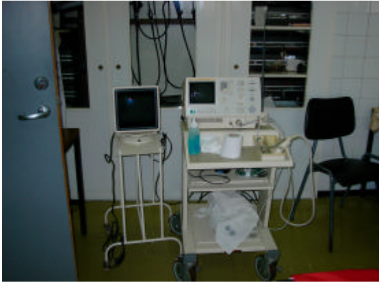
Es gibt noch ein modernes Siemens-System im Haus, die meisten Untersuchungen werden aber mit solchen Geräten durchgeführt.