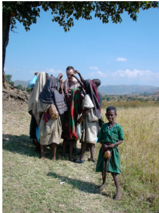
schwindelfreies Kind und Andenkenverkäufer